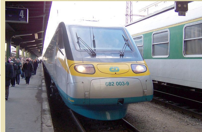
spěšný vlak Pendolino

Přepravuje osoby i náklad (např. stavebniny a uhlí).