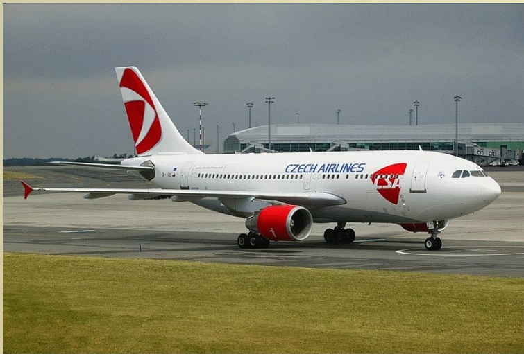
Airbus A310-300 společnosti České aerolinie na ruzyňském letišti

Největší letiště je Praha-Ruzyně, které ročně přepraví kolem 10 milionů pasažérů. V Česku je celkem 46 letišť se zpevněným povrchem, z nichž šest vypravuje mezinárodní lety.