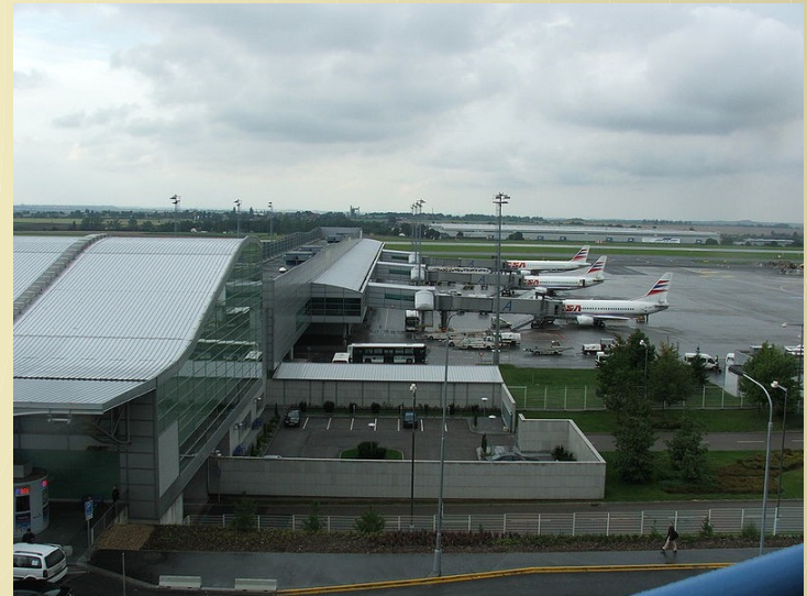
Mezinárodní letiště Ruzyně - Terminál T1